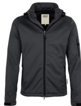
848 Softshelljacke Ontario anthrazit