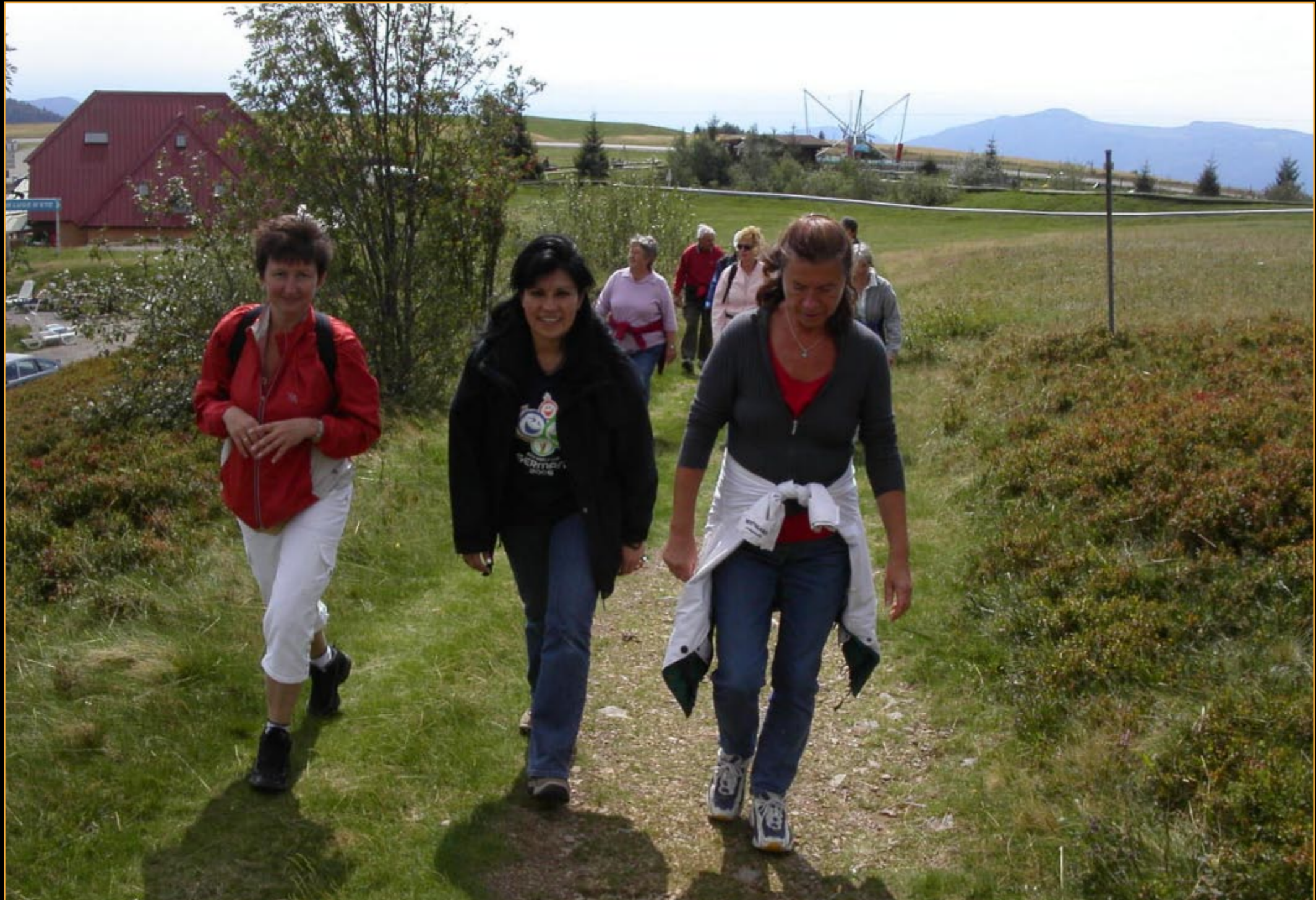
Elsass Lac de Kruth